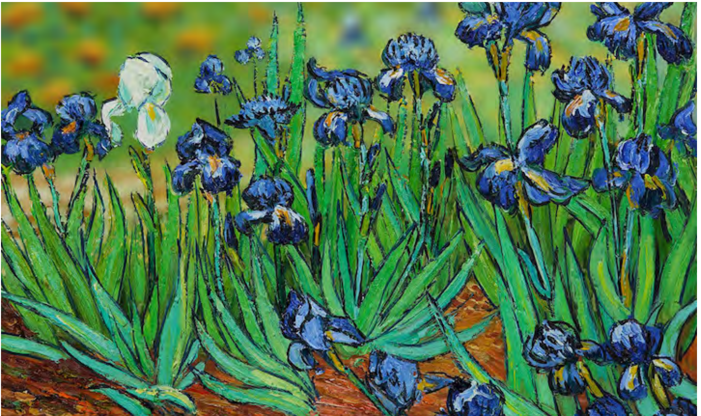
Lirios de Van Gogh tratados por Melonshade

Boletín del Comité Ejecutivo #2 - Gestión 2018-2020