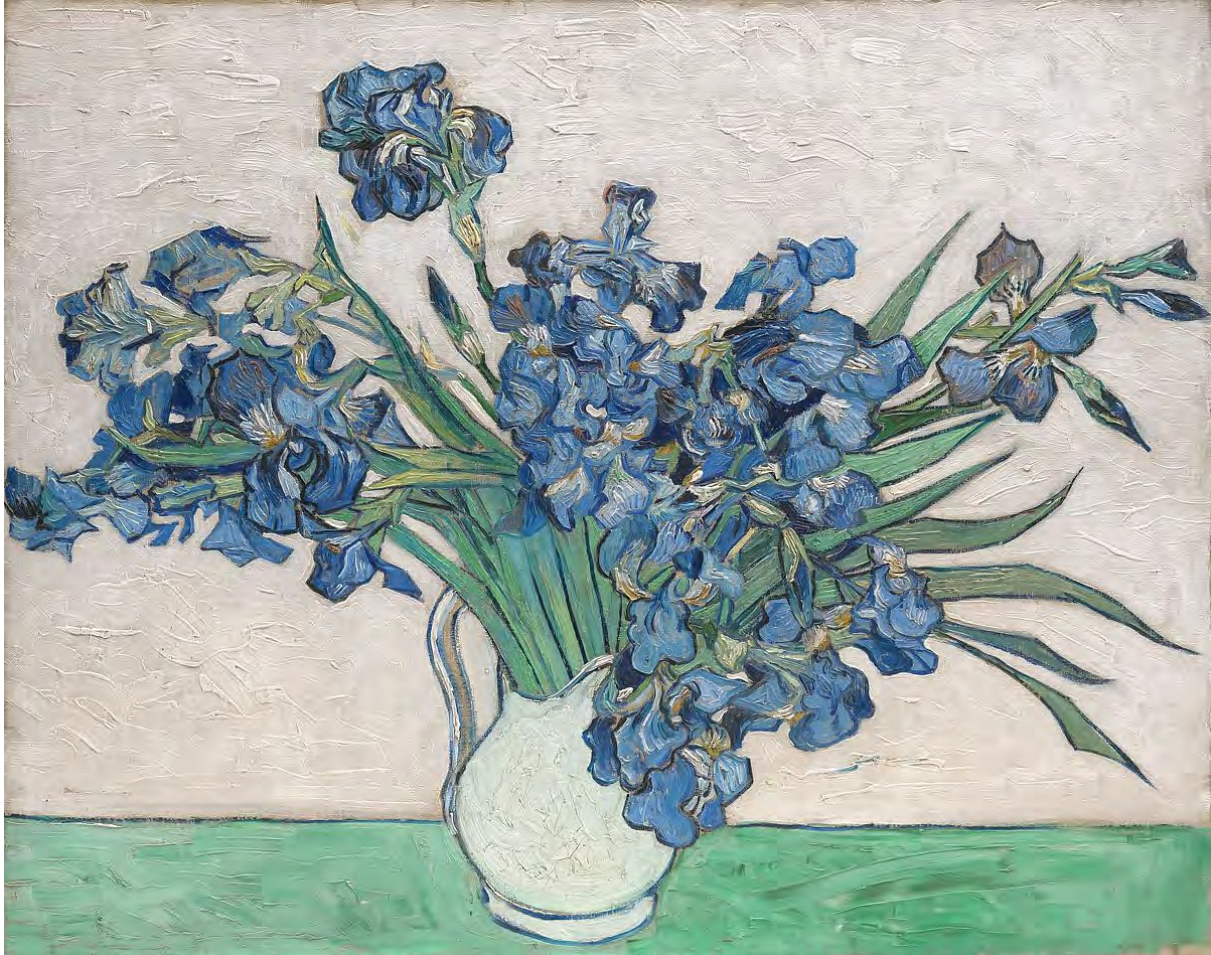
Iris - Van Gogh

Boletín del Comité Ejecutivo #4 - Gestión 2018-2020